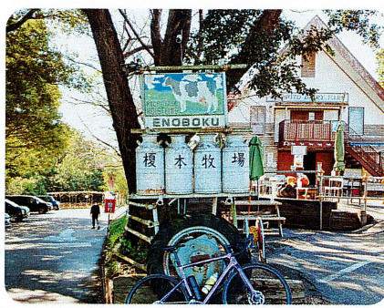
榎本牧場の正面口