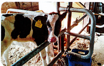
今年生まれの子牛

《公共交通》上尾駅西口から市内循環バス「ぐるっとくん」で平丸山公園線もしくは東武バスの「畔吉經由西上尾車庫行き」に乗って「畔吉停留所」(所要時間約30分)で下車後、徒歩5分です。バス本数が少ないので注意してください。《車》圏央道桶川北本(か)から約10分 《駐車場》有り：無料